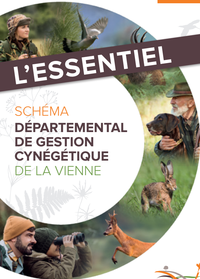
SCHÉMA DÉPARTEMENTAL DE GESTION CYNÉGÉTIQUE DE LA VIENNE