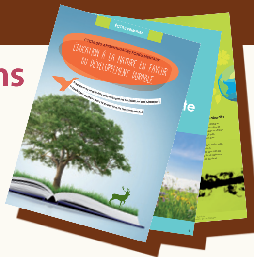
Document "Éducation à la Nature"