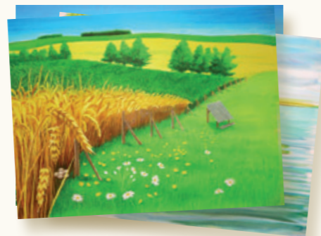
Habitat naturel - La plaine

Mais, les missions des Fédérations ont été essentiellement orientées vers des sorties en nature et l'exploitation des connaissances sur le terrain. A cet effet, les Fédérations des Chasseurs ont principalement développé le principe des sentiers pédagogiques qui permettent une mise en situation et s'adaptent très facilement aux aspects des programmes sur lesquels les enseignants souhaitent mettre l'accent. La plupart de ces sentiers pédagogiques sont situés sur les sites de la Fondation pour la Protection des Habitats de la Faune Sauvage dans des espaces emblématiques du territoire observé.